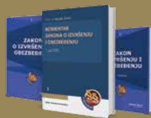
ZAKON O IZVRŠENJU I OBEZBEĐENJU KOMPLET OD 3 KNJIGE