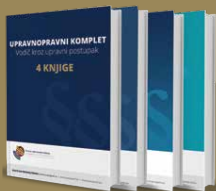
UPRAVNOPRAVNI KOMPLET VODIČ KROZ UPRAVNI POSTUPAK

DETALJNIJE INFORMACIJE I PORUČIVANJE NA WWW.PARAGRAF.RS