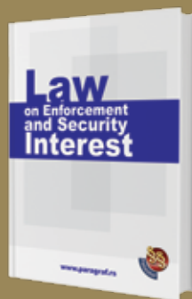
LAW ON ENFORCEMENT AND SECURITY INTEREST Prevod Zakona o izvršenju i obezbeđenju na engleski jezik