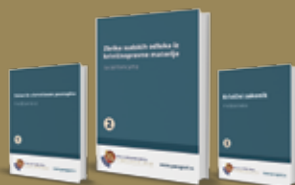
KOMPLET KRIVIČNOPRAVNE LITERATURE