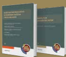
KOMPLET LITERATURE ZA BUDŽETSKO RAČUNOVODSTVO