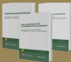
KOMPLET LITERATURE ZA JAVNE NABAVKE