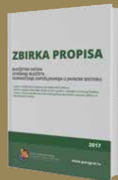
ZBIRKA PROPISA IZ OBLASTI BUDŽETSKOG SISTEMA I ZAPOŠLJAVANJA U JAVNOM SEKTORU